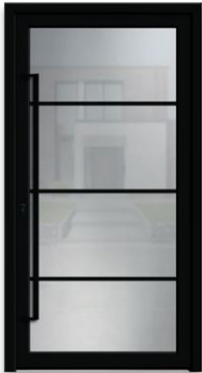
LOFT 4 | réf 64.03

Double vitrage : croisillons 20 mm aspect acier noir incorporés dans l'espace d'air |