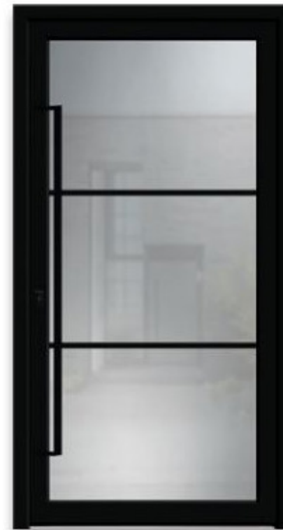
LOFT 3 | réf 63.03

Double vitrage : croisillons 20 mm aspect acier noir incorporés dans l'espace d'air |