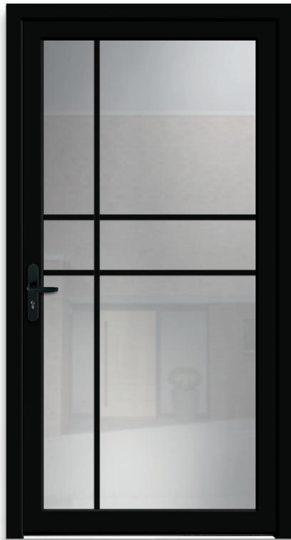
LOFT 1 | réf 66.03

Double vitrage : croisillons 20 mm aspect acier noir incorporés dans l'espace d'air |