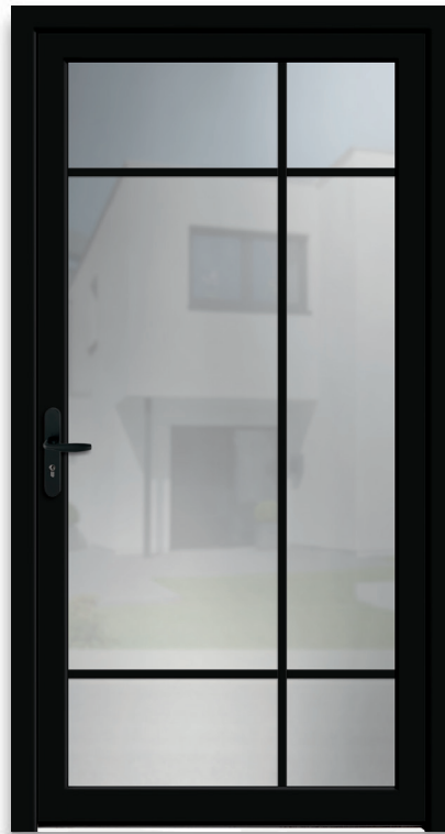
LOFT 2 | réf 65.03

Double vitrage : croisillons 20 mm aspect acier noir incorporés dans l'espace d'air |